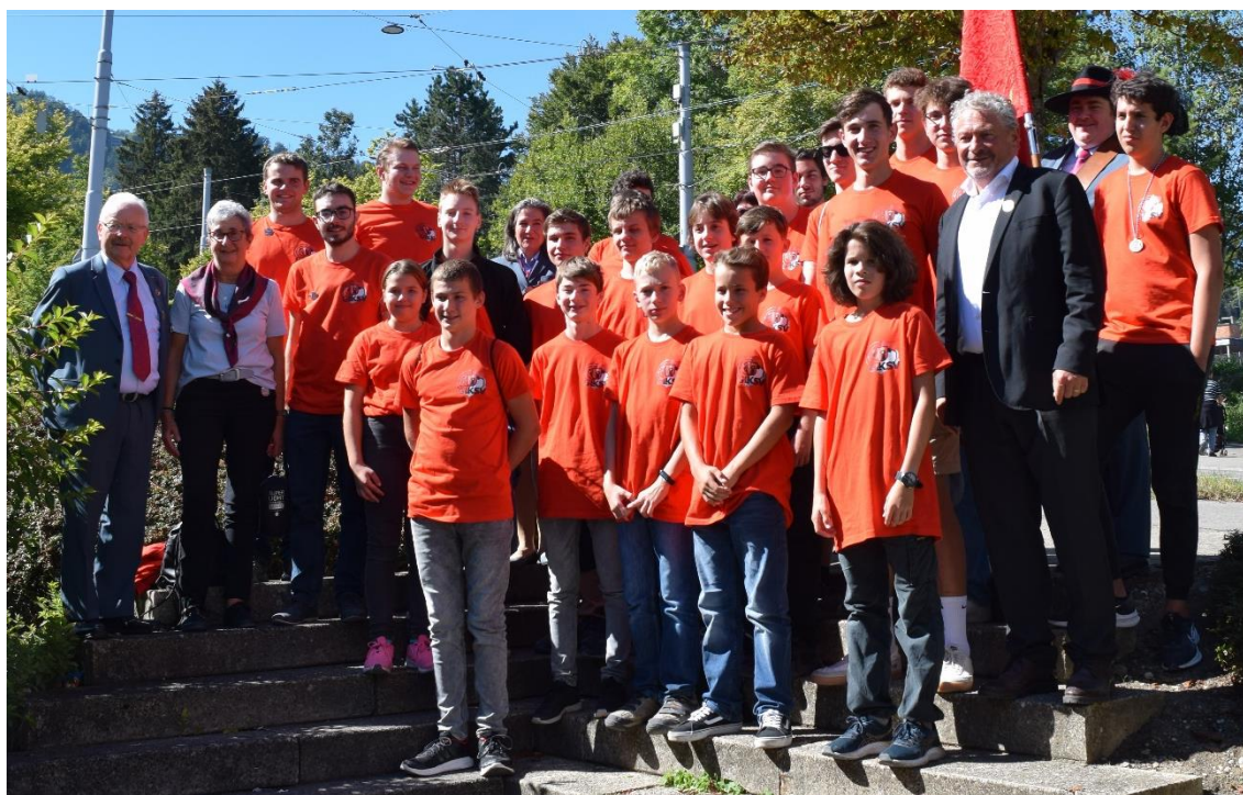
Gruppenbild der Glarner Delegation am Knabenschiessen 2022

Daraufhin auf dem Festgelände angelangt, wurde der Gabentempel vorgestellt. «Ich nehme den Fernseher», hört man beispielsweise aus den Reihen eines Jungschützen, doch wird er morgen genügend Punkte erreichen? Wer weiss... Dann durfte natürlich der erste Chilbi-Besuch nicht fehlen. Das Nachtessen im Albisguetli war dann der nächste Fixpunkt. Und nochmals durfte man sich an der Chilbi vergnügen. Gegen 22.00 Uhr fuhr der Car zurück in die Unterkunft, doch wer noch bleiben wollte, durfte dies ebenfalls. So klang der Abend am Billardtisch in der Bar der Unterkunft, oder eben der Knabenschiessen-Chilbi aus.