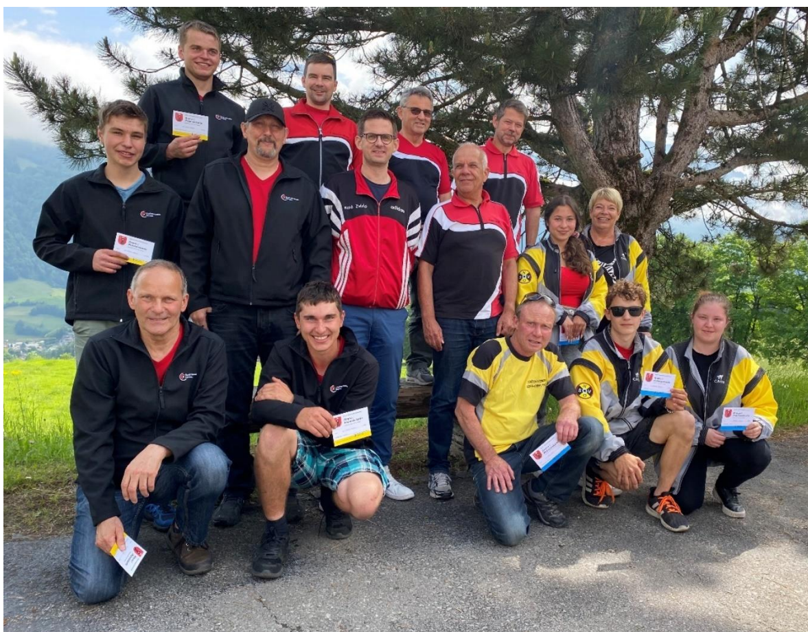
Feld E: SV Netstal; Kantonalmeister Standschützen Niederurnen, SV Nieder-Oberurnen