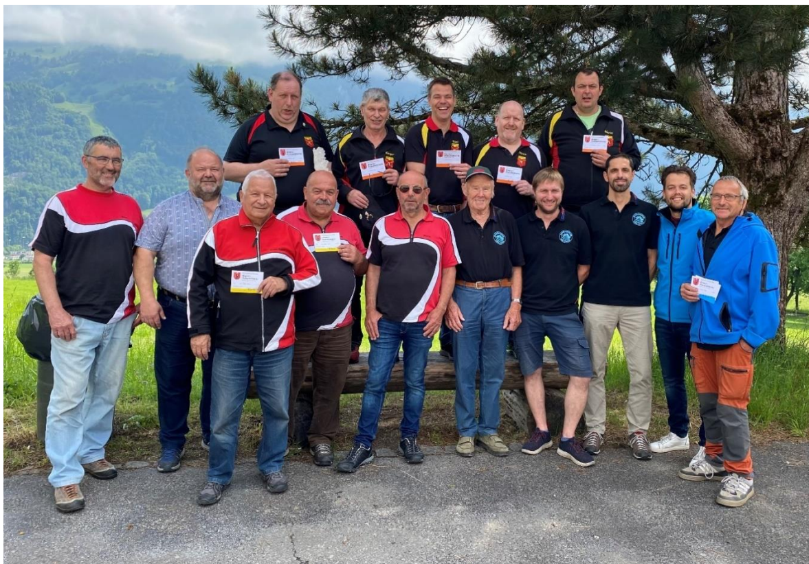
Feld D: Standschützen Niederurnen; Kantonalmeister SG Ennenda; SV Linthal-Auen