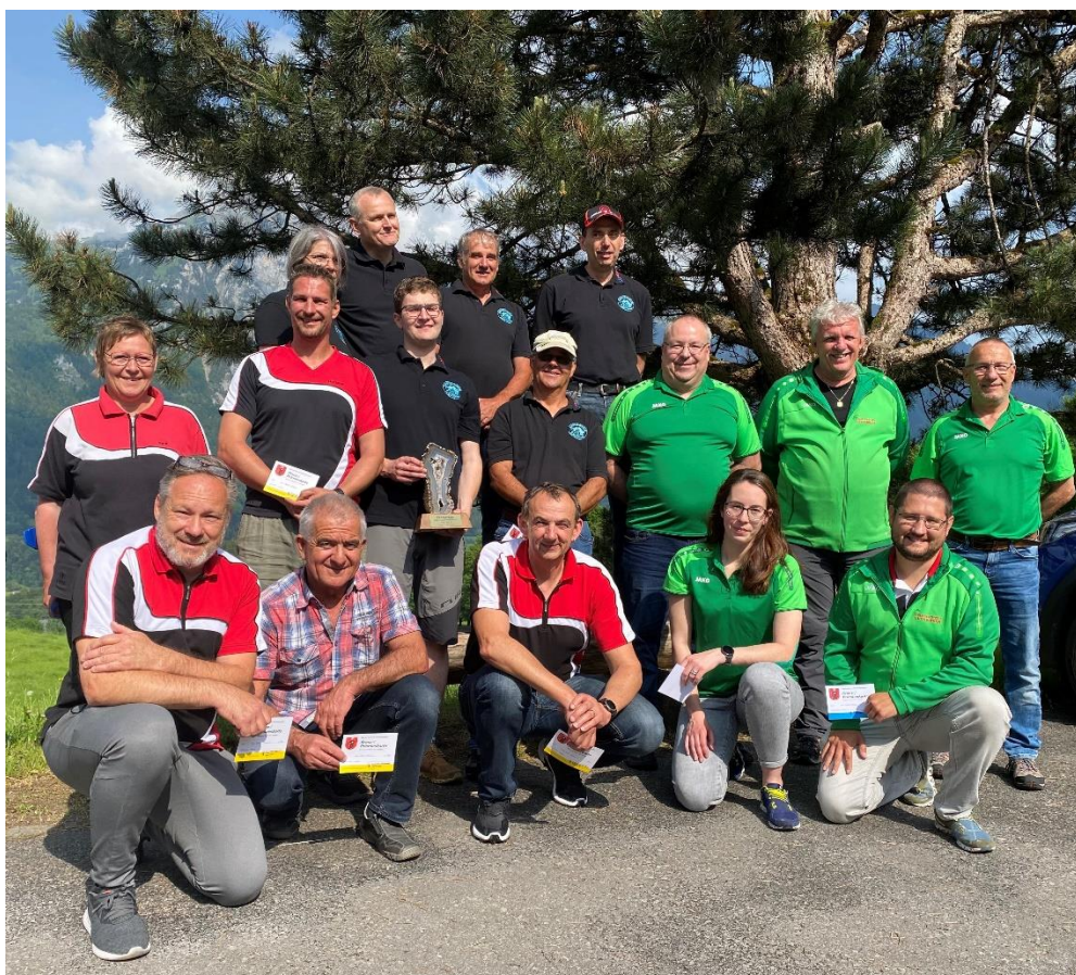
Standsschützen Niederurnen; Kantonalmeister Linthal-Auen; FS Luchsingen